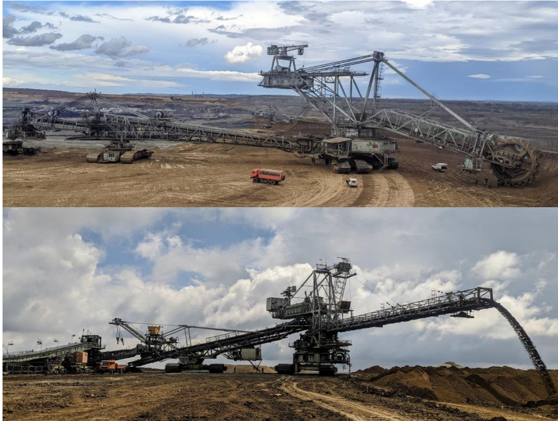
Slika 1. Rotorni bager SRs 2000.32/5+VR i odlagač A 2 RsB-8500

Kroz rad biće analizirani proizvodni učinci za maj mesec tekuće godine, po smenama. Kako se proizvodnja obavlja u tri smene po osam sati, organizacija zaposlenih prema sistematizaciji radnih mesta podeljena je u četiri grupe: A, B, C i D smena.